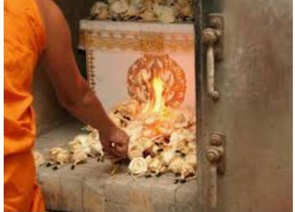
Buddhist Death ritual